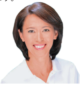
有森 裕子 Yuko Arimori

ランナーのみなさまへの応援や公式イベントに参加していただき、大会を盛り上げていただきます。