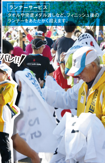
ランナーサービス タオルや完走メダル渡しなど、フィニッシュ後のランナーをあたたく迎えます。