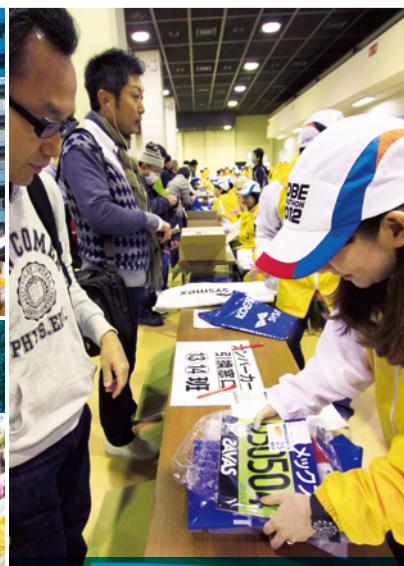
ランナー受付 期待でいっぱいランナーを、一番最初に迎えます。