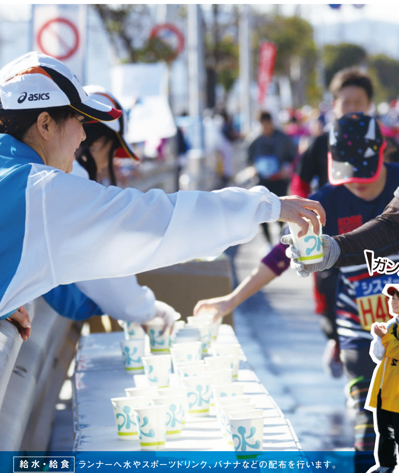
給水・給食 ランナーへ水やスポーツドリンク、バナナなどの配布を行います。