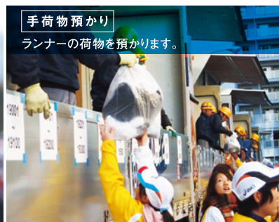
手荷物預かり ランナーの荷物を預かります。