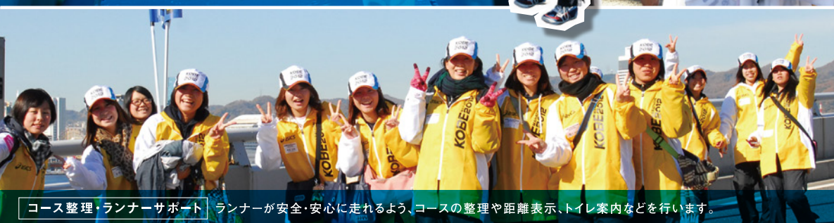
コース整理・ランナーサポート ランナーが安全・安心に走れるよう、コースの整理や距離表示、トイレ案内などを行います。