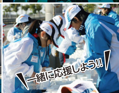
一緒に応援しよう!!